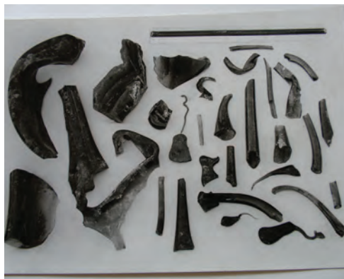
Pièces et coulées de verre retrouvées au Sclage dans les années 1950

Bousval et Cérroux-Mousty virent s'installer des verreries fondées par les familles Colnet et de Ferri (seigneur de Moriensart), l'une originaire de Thiérache et l'autre provenant du Hainaut. Ils produisirent du menu verre (gobelets). Les maîtres verriers de Hennezel, originaires de Lorraine, exploitèrent des fours à grand verre (verre plat) à Wez. En 1621, ils furent bannis comme réformés par les archiducs Albert et Isabelle.