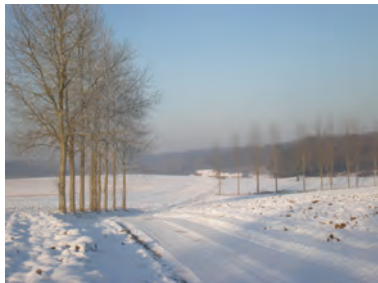
La ferme Del Wastez à Baisy-Thy