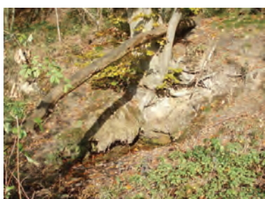
Source au chemin Bruyère Delvigne

Bousval et Cérroux-Mousty virent s'installer des verreries fondées par les familles Colnet et de Ferri (seigneur de Moriensart), l'une originaire de Thiérache et l'autre provenant du Hainaut. Ils produisirent du menu verre (gobelets). Les maîtres verriers de Hennezel, originaires de Lorraine, exploitèrent des fours à grand verre (verre plat) à Wez. En 1621, ils furent bannis comme réformés par les archiducs Albert et Isabelle.