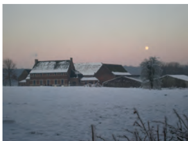
La ferme d'Agnissart à Baisy-Thy