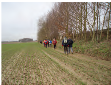
La drève Bousval à Baisy-Thy