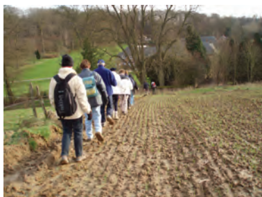
Le sentier de la Bruyère de Glabais à Ways